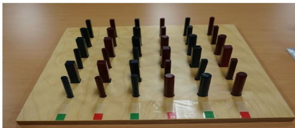
<좌측면> Left Side image