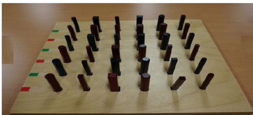
<정면> Front Side image

[Сүлбээр тогтоох хавтан : Хэмжээ : 380 x 380mm]